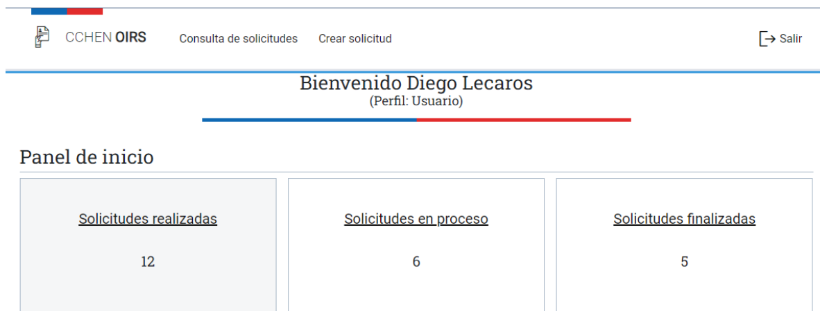
Ilustración 10 - Panel de inicio

Al ingresar al sistema se abre esta pantalla principal la cual posee todas las opciones disponibles para usted en el menú superior y sus estadísticas en las cajas del panel de inicio.