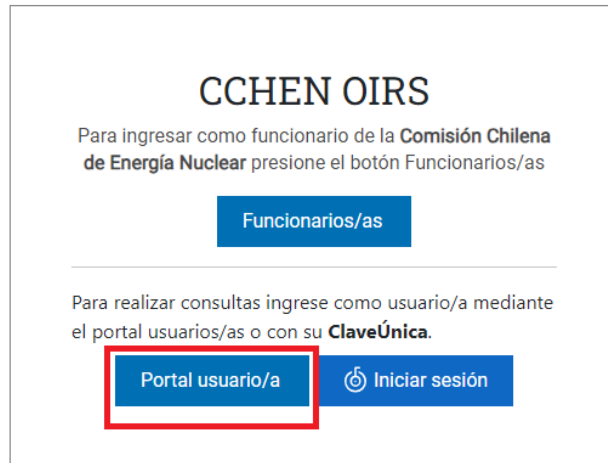
Ilustración 1 - Menú de inicio

Luego de presionar el botón portal usuarios se abrirá una nueva ventana la cual permite ingresar sus credenciales para iniciar sesión.