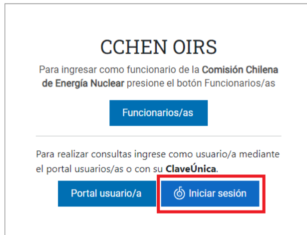
Ilustración 6 - Menú inicio

La segunda manera de ingresar al sistema es mediante ClaveÚnica.