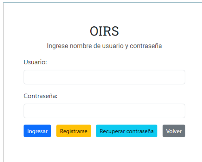
Ilustración 2 – Credenciales de inicio

Luego de presionar el botón portal usuarios se abrirá una nueva ventana la cual permite ingresar sus credenciales para iniciar sesión.