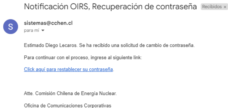
Ilustración 5 - Correo de recuperación

La única forma de restablecer su contraseña es utilizando el link que llegara a su correo del sistema.