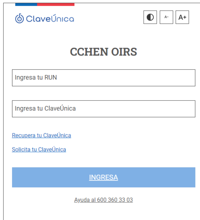
Ilustración 7 - Formulario ClaveÚnica

Luego de un momento se desplegará el formulario del gobierno donde se solicitan las credenciales de ClaveÚnica.